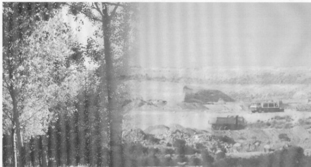
La diferencia entre "sostenible" e "insostenible" reside en que será el futuro quien determine los errores cometidos

"aquel capaz de proveer las necesidades de las generaciones actuales sin comprometer a que nuestros futuros descendientes sean capaces de proveerse de las