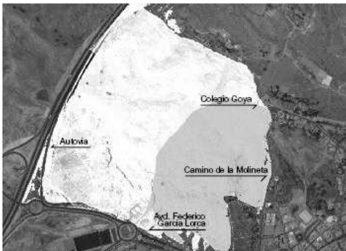
En gris claro y blanco zona recalificada como urbanizable